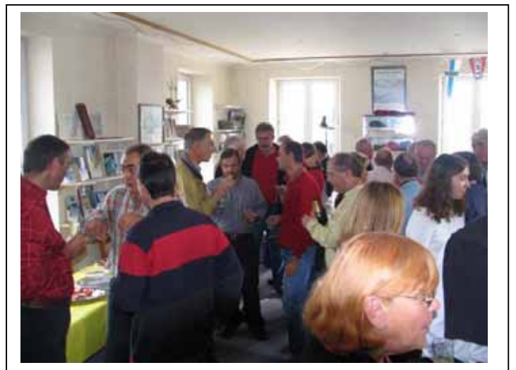
Pot de l'amitié après la remise des prix