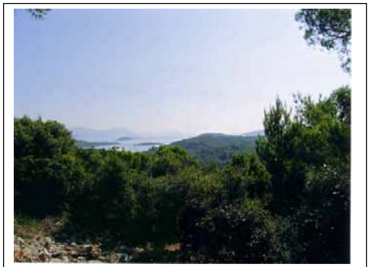
Le maquis et les milliers d'îles