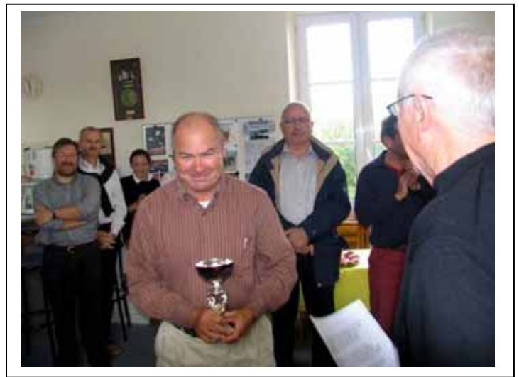
La Fidélity Cup remise au bateau CHORALE