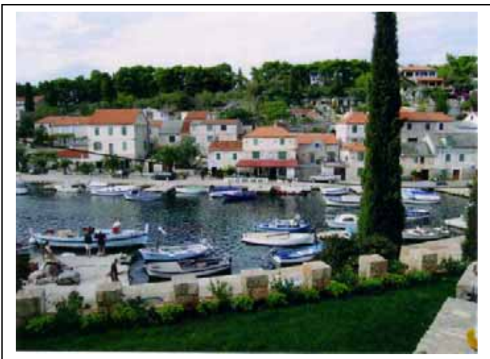
Maslinjea : Ile de Solta