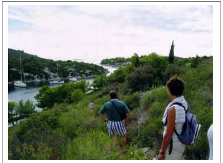
Mouillage forain sur l'île de Solta