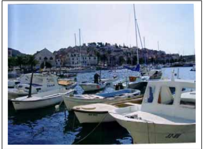
Port de HVAR