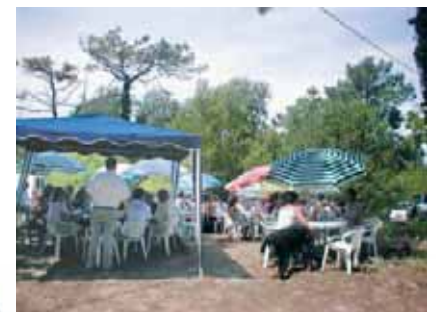
Pique Nique à Karola