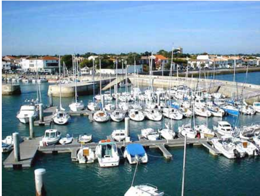
L'avant-port de La Flotte et les bateaux du C.N.L.F.