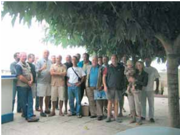
Prêts pour la distribution des prix et le barbecue !

Le 12 juillet 2006 à 7h30, 20 pêcheurs embarqués sur 10 bateaux ont pris le large sur une mer calme.