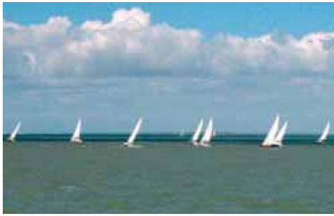
Départ dans la brise