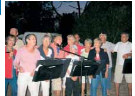
Les choristes du CNLF

Pour l'avenir, il serait souhaitable, compte tenu de la densité du programme d'activités de ce secteur, que ces commissions puissent être renforcées par plusieurs membres supplémentaires. L'appel est lancé.