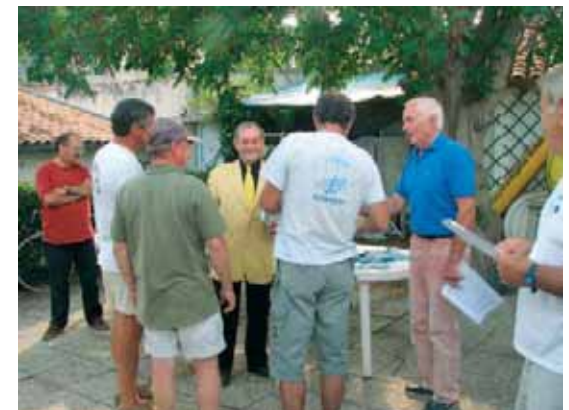
Régates du Conseil Général