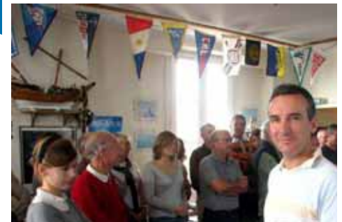
Le vainqueur du challenge 2006, catégorie «bateaux de régates»