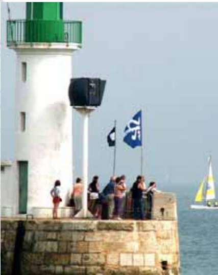
Départ de régates côté organisateurs