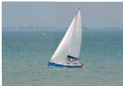
Vers la victoire ?!

La saison 2006 au cours de laquelle cent quarante bateaux ont participé aux douze régates organisées par le C. N. L. F. a donné comme les années précédentes une certaine animation devant le port de La Flotte.