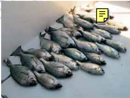
Les prises du vainqueur