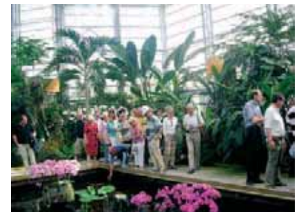
Aux Jardins du Monde