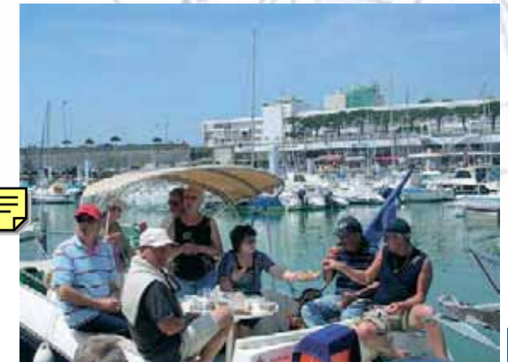
Le CNLF à Royan

Avec 4 bateaux et 8 adhérents bien accueillis par la capitainerie et BBQ du port sous grand beau temps (sortie à renouveler)..