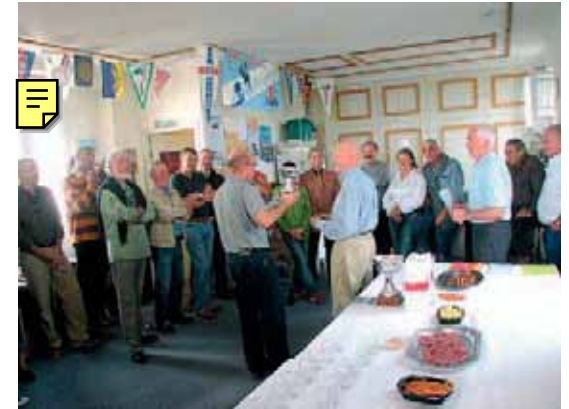
Remise de la Fidelity cup 2006

La saison 2006 est terminée, vive la saison 2007 où 12 régates sont déjà programmées !