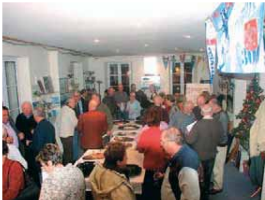
Pot de fin d'année