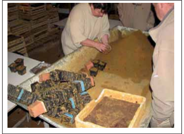
Visite d'un élevage d'escargots et dégustation