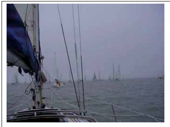
Régate Tour de l'Île organisée par la SRR