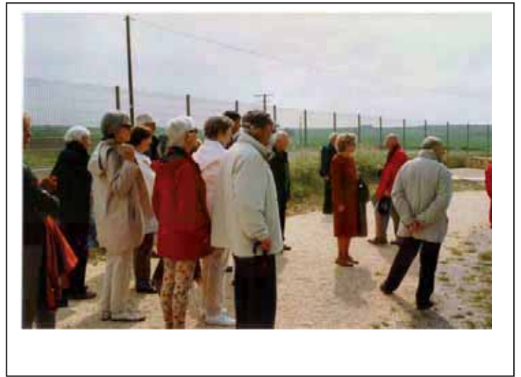
Visite du Fâ à Talmont