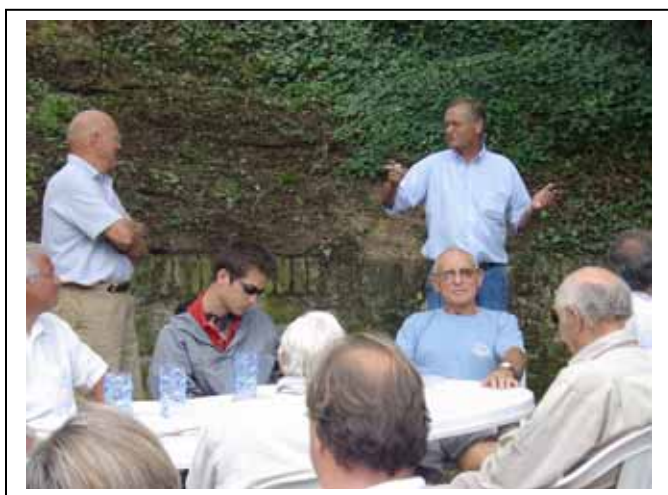
Samedi 28 Juillet : Pique Nique dans les jardins du Phare des Baleines