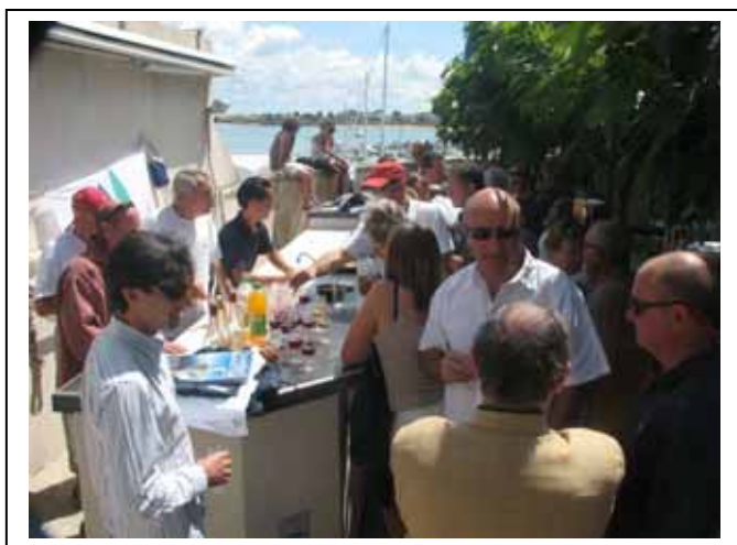
Régate du 22 juillet 2007 : Coupe du Conseil Général