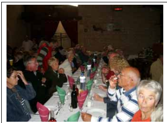
Samedi 5 Mai 2007 : Visite d'une distillerie à St Romain de Bonnet