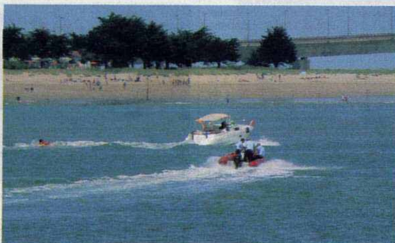
Les "affmar" en train d'intercepter un plaisancier au large de Rivedoux.

Les amendes peuvent être salées. Pour un gilet manquant à bord, l'amende peut s'élever à 1 500 €. L'absence de fusées de détresse en cours de validité est également sanctionnée de 1 500 € maximum. Quant aux excès de vitesse à moins de 300 mètres de la côte, ils peuvent occasionner un retrait du permis mer (cette sanction administrative est infligée par la direction des affaires maritimes).