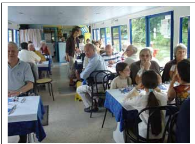
Jeudi 12 Juillet : Sortie sur le Collibert II