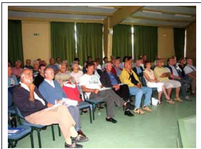
Samedi 28 Avril : présentation saison 2007