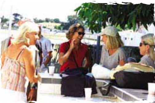
La Fiancée du Pirate