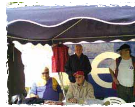
Stand à la Fête du Nautisme

Au total, plus de 1750 participations ont été enregistrées à l'actif de ces manifestations conviviales, qui permettent tout autant de se remémorer nos sorties en mer ou nos pêches miraculeuses et de prolonger la saison.