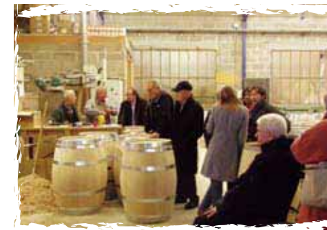
Maine au Bois