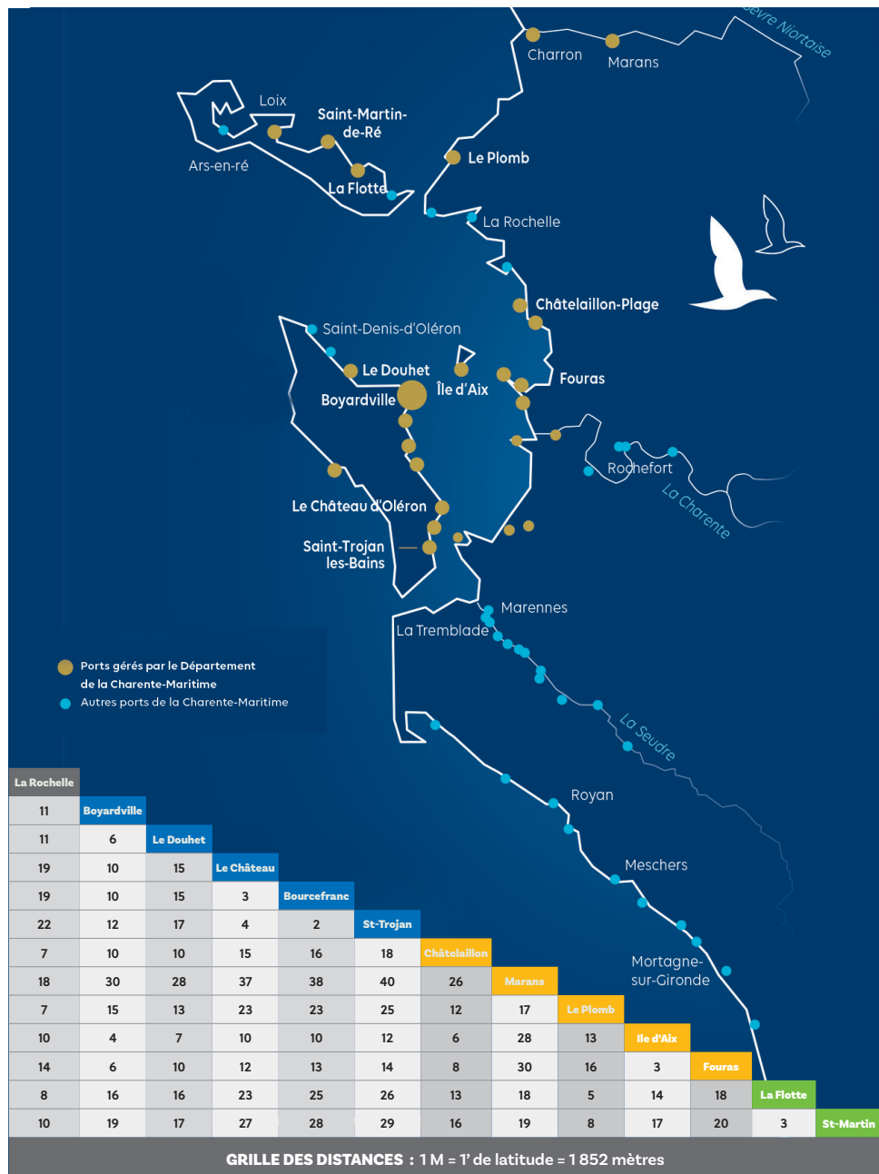
GRILLE DES DISTANCES : 1 M = 1' de latitude = 1 852 mètres